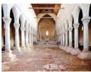
Bild 5: Basilika von Aquileia, Kircheninneres

Bild 4: Augustinus, Fresko in der Kirche San Agostino, San Gimignano (Benozzo Gozzoli, 15. Jahrhundert), Quelle: http://www.sbg.ac.at/ger/samson/rvws2006-07/rohr2006_bild.htm (dort Abb. 1); Foto: Christian Rohr