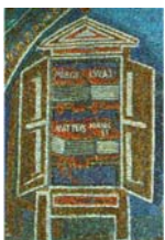
Bild 10: Armarium (Bücherschrank): Mosaik über dem Grab der Galla Placidia, Ravenna; Quelle: http://www9.georgetown.edu/faculty/jod/Picts/bookcase.large.gif (James J. O'Donnell)

Bild 9: Apsis von Hippo Regius, Quelle: http://www9.georgetown.edu/faculty/jod/algeria/hippo-scenes.html (James J. O'Donnell)