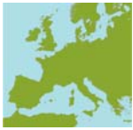
Bild 12–21: Landkarten, Quelle: Wikipedia (Autor: San Jose), Karten bearbeitet http://de.wikipedia.org/wiki/Bild:Template_europe_map.png