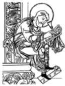
Bild 22: Schreiber (schwarz/weiß): Benedictionale Aethelwoldi (fol. 92v), British Library (Add. Ms. 49598); Quelle: www.lrz-muenchen.de/~arch/mitt/m118-7.jpg (Brigitte Haas-Gebhard)