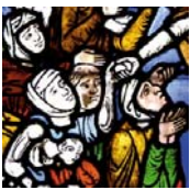
Bild 36: Elisabeth gibt A l m o s e n , Detail aus einem Fenster der Elisabethkirche Marburg