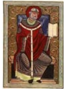
Bild 21: Buchmalerei, Gregor, 12. Jahrhundert, aus einem Manuskript von Abbaye de Saint-Amand Pévèle, in der Bibliothèque Nationale in Paris; Quelle: Ökumenisches Heiligenlexikon http://www.heiligenlexikon.de/BiographienG/Gregor_I_der_Grosse.htm