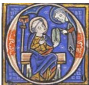
Bild 24: zwei Heilige (blaue Initiale): Princeton University, Garrett MS 28, 356r.; Quelle: Wikipedia; http://en.wikipedia.org/wiki/File:Conversation-saints_01.jpg