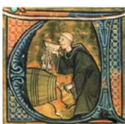
Bild 44: t r i n k e n d e r M ö n c h , British Library, London, Scan aus Maggie Black "Den medeltida kokboken"; Quelle: Wikipedia (Peter Isotalo); http://de.wikipedia.org/wiki/Esskultur_des_Mittelalters