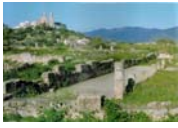
Bild 1: Basilika von Hippo Regius, Quelle: http://www9.georgetown.edu/faculty/jod/algeria/algeria-sitevisits.html ; mit freundlicher Genehmigung von: James J. O'Donnell

Die Bilder 3, 5, 8, 12, 13–21, 23 und 28–30 von D. Weber und V. Zimmerl-Panagl bearbeitet