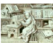
Bild 31: Schreiber in mittelalterlicher Schreibstube