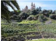
Bild 2: Basilika von Hippo Regius, Quelle: http://bhofmann.blog.24heures.ch/archive/2008/03/19/annaba-en-cours-de-r%C3%A9volution.html ; Foto zur Verfügung gestellt von: Blaise Hofmann

Bild 1: Basilika von Hippo Regius, Quelle: http://www9.georgetown.edu/faculty/jod/algeria/algeria-sitevisits.html ; mit freundlicher Genehmigung von: James J. O'Donnell